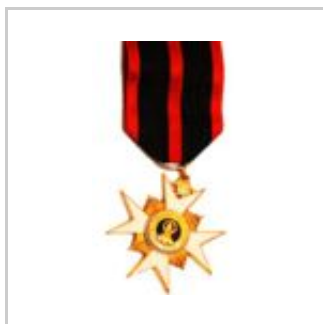
Ritterkreuz des Silvesterordens