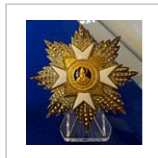
Stern der Großkomtur des Silvesterordens