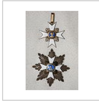
Kreuz und Stern der Großkomtur