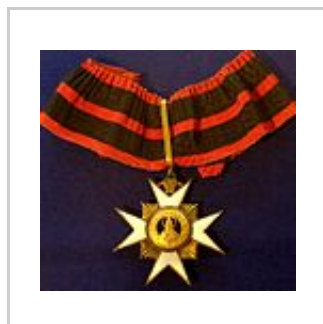
Komturkreuz des Silvesterordens